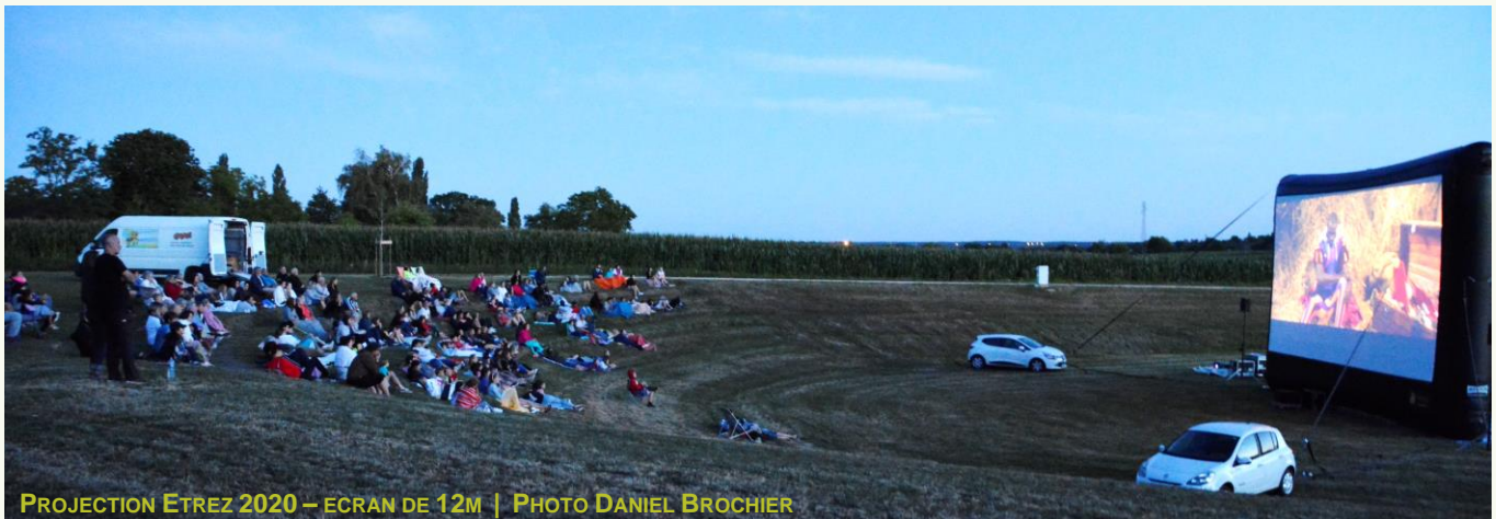
PROJECTION ETREZ 2020 – ECRAN DE 12M