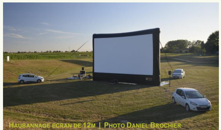
HAUBANNAGE ECRAN DE 12M

• Le projecteur est posé sous un barnum que nous fournissons